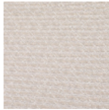
3268-04 LES CRAIES - AXIS