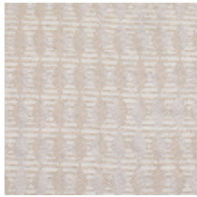
3268-01 LES CRAIES - BIG LOSANGE