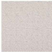
3268-09 LES CRAIES - DEDALE