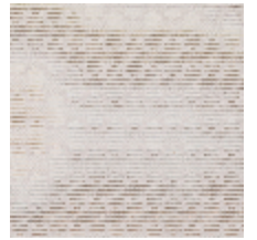
3268-06 LES CRAIES - RECTANGLE