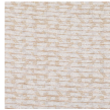
3268-05 LES CRAIES - DELTA