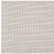
3268-02 LES CRAIES - LOSANGE