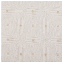
3268-07 LES CRAIES - BIG DEDALE