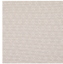
3268-04 LES CRAIES - AXIS