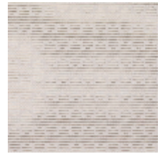
3268-06 LES CRAIES - RECTANGLE