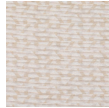
3268-05 LES CRAIES - DELTA