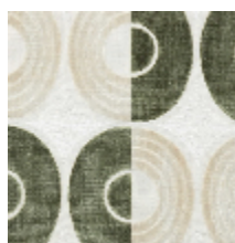
3280-04 EQUINOX - LICHEN