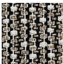
3281-03 ODORICO - CARBONE