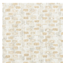
3281-01 ODORICO - NATUREL