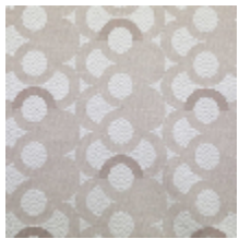
3283-01 MAELSTROM - NACRE