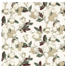
3285-02 SAYURI - PRUNE