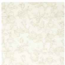
3285-01 SAYURI - NATUREL