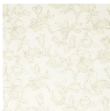
3285-01 SAYURI - NATUREL