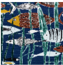
3286-02 LAGON - MARINE