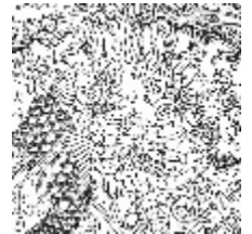
3303-06 HORIMONO - NOIR