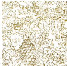
3303-02 HORIMONO - OR