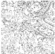
3303-01 HORIMONO - ARGENT