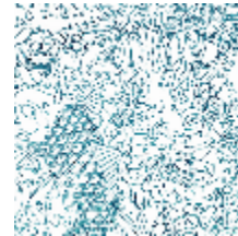
3303-05 HORIMONO - CANARD