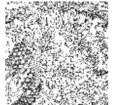
3303-06 HORIMONO - NOIR