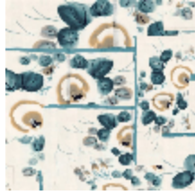
3317-03 ANASTASIA - BLEU *