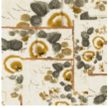
3317-01 ANASTASIA - NATUREL *