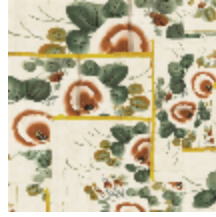
3317-04 ANASTASIA - DORE *