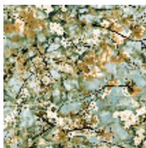
3321-02 CERISIER – DORE *