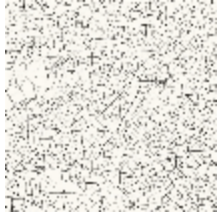
3329-01 THEBAÏDE PORCELAINE