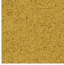
3329-02 THEBAÏDE SABLE