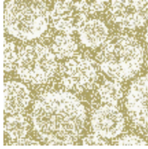
3334-02 PUNTO MADAMA - POLLEN