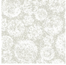
3334-01 PUNTO MADAMA - NATUREL