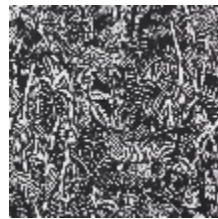
3410-05 AFRIKA - NOIR