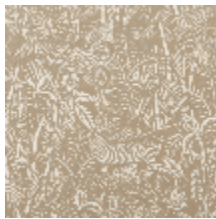
3410-02 AFRIKA - SABLE