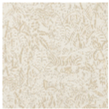
3410-01 AFRIKA - NATUREL