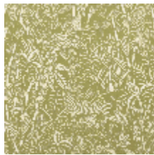
3410-03 AFRIKA - TILLEUL