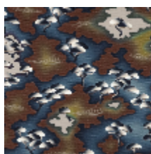
3416-02 MESAÏ - FAUVE

lelievrepairs.com contact@lelievrepairs.com