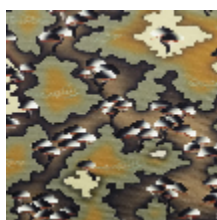
3416-01 MESAÏ - KAKI