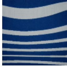
3434-05 ILLUSION - MARIN *