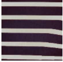
3434-02 ILLUSION - NECTAR *