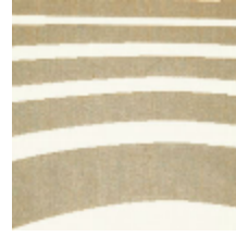
3434-06 ILLUSION - BEIGE *