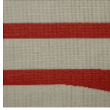
3434-04 ILLUSION - LAQUE *