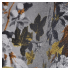
3437-03 MOUSSON - GOLD *