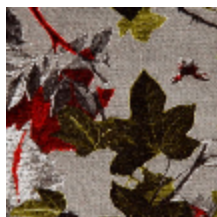
3437-01 MOUSSON - NECTAR *