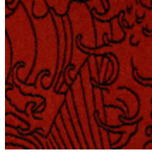
3440-04 SKIN - LAQUE