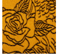
3440-06 SKIN - GOLD