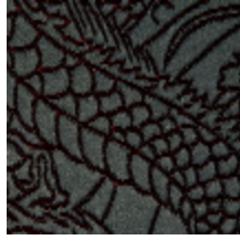
3440-03 SKIN - NECTAR