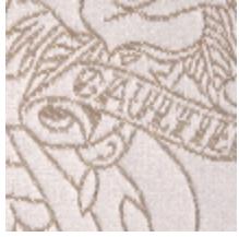
3440-01 SKIN - BEIGE