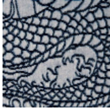
3440-02 SKIN - ENCRE