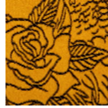
3440-06 SKIN - GOLD