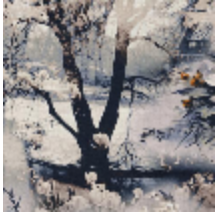
3441-01 VAGABOND - TERRE *