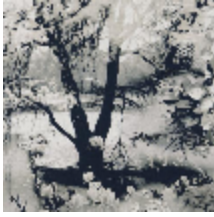
3441-02 VAGABOND - GRAPHITE *