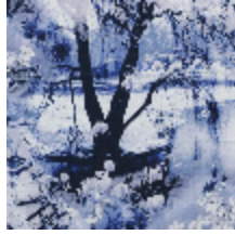
3441-03 VAGABOND - ENCRE *