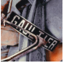
3442-01 FANGIO - TERRE