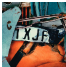
3442-02 FANGIO - PETROLE