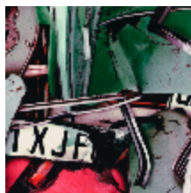
3442-03 FANGIO - SANGUINE