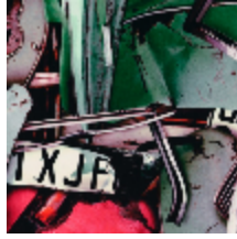
3442-03 FANGIO - SANGUINE