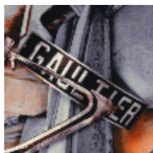
3442-01 FANGIO - TERRE