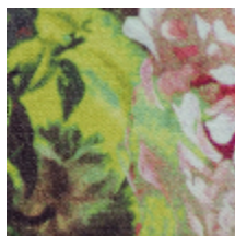
3459-02 BOTANIQUE - POLLEN