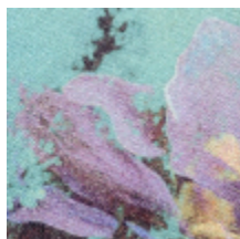
3459-01 BOTANIQUE - BLEUET