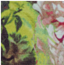
3459-02 BOTANIQUE - POLLEN