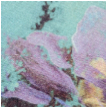
3459-01 BOTANIQUE - BLEUET