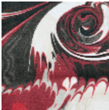
3460-02 VOGUE - LAQUE *