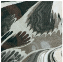
3460-01 VOGUE - SABLE *