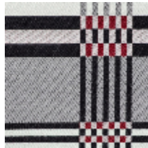
3461-04 ST JEAN DE LUZ - LAQUE