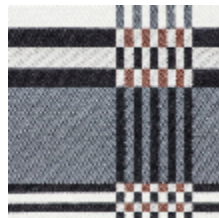
3461-03 ST JEAN DE LUZ - CHATAIGNE *