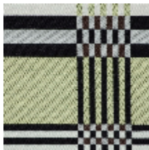
3461-02 ST JEAN DE LUZ - POLLEN *