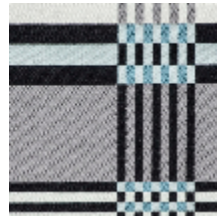
3461-05 ST JEAN DE LUZ - CIEL