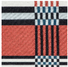
3461-01 ST JEAN DE LUZ - PETROLE