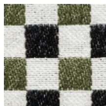
3462-09 BIARRITZ - KAKI *