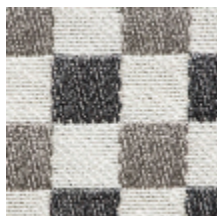
3462-01 BIARRITZ - TAUPE *