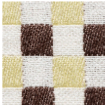
3462-03 BIARRITZ - POLLEN *