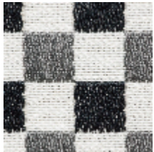
3462-02 BIARRITZ - ANTHRACITE *