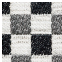
3462-02 BIARRITZ - ANTHRACITE *