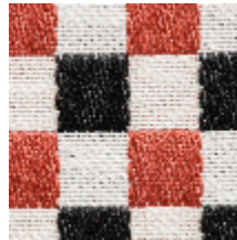
3462-06 BIARRITZ - CORAIL *