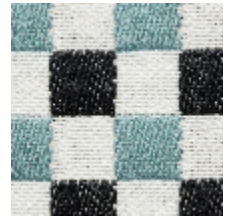
3462-08 BIARRITZ - CIEL *