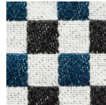
3462-07 BIARRITZ - PETROLE *