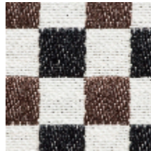
3462-04 BIARRITZ - BRUN *