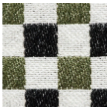
3462-09 BIARRITZ - KAKI *