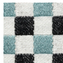
3462-08 BIARRITZ - CIEL *