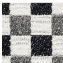
3462-02 BIARRITZ - ANTHRACITE *