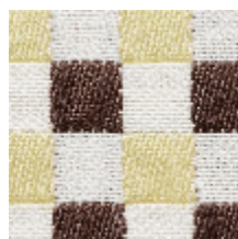
3462-03 BIARRITZ - POLLEN *