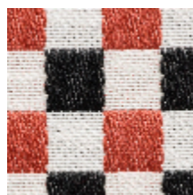
3462-06 BIARRITZ - CORAIL *