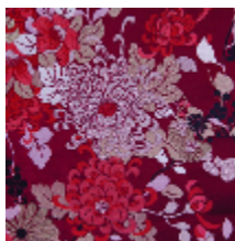
3466-02 KYOTO - GRENAT