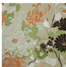
3466-01 KYOTO - TAUPE