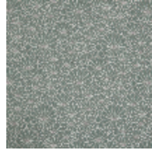
3467-07 OBI - CIEL