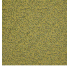
3467-03 OBI - DORE