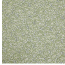
3467-05 OBI - AMANDE