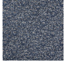
3467-08 OBI - MARINE