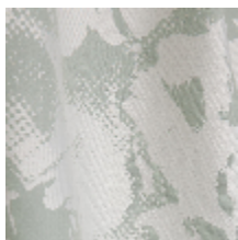
3470-01 PIVONKA - AMANDE