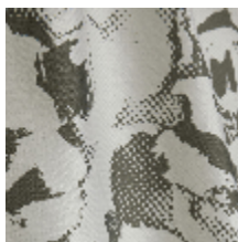
3470-02 PIVONKA - ANTHRACITE