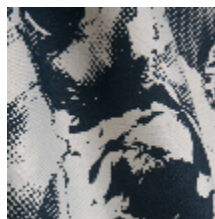
3470-04 PIVONKA - MARINE