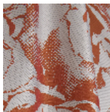
3470-03 PIVONKA - ORANGE