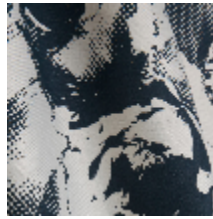
3470-04 PIVONKA - MARINE