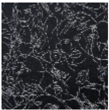
3471-01 REGARD - NOIR