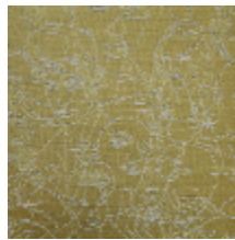
3471-04 REGARD - OR