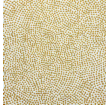
3473-04 ESCALE - DORE