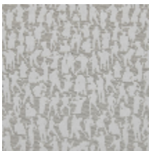
3492-01 SILHOUETTES - NATUREL