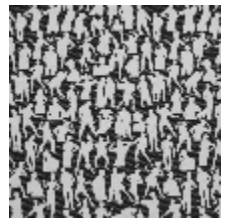
3492-06 SILHOUETTES - NOIR