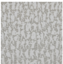
3492-01 SILHOUETTES - NATUREL