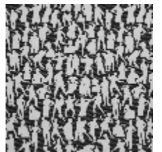
3492-06 SILHOUETTES - NOIR