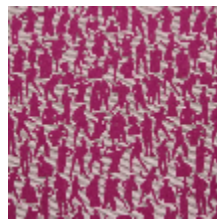
3492-05 SILHOUETTES - FUCHSIA