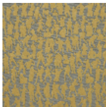
3492-02 SILHOUETTES - JAUNE