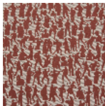
3492-03 SILHOUETTES - TERRACOTTA