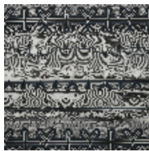
3493-03 STRIPE - PETROLE