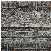
3493-01 STRIPE - CUIVRE