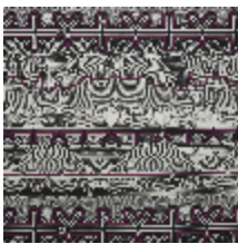
3493-02 STRIPE - FUCHSIA