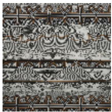
3493-01 STRIPE - CUIVRE