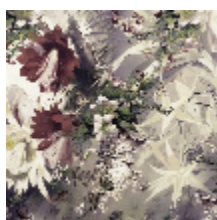
3497-01 FLOWER POWER - PASTEL