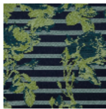
3615-04 CROISIERE - MARINE