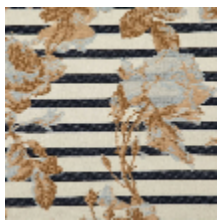
3615-01 CROISIERE - NATUREL