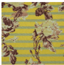
3615-02 CROISIERE - BERGAMOTE