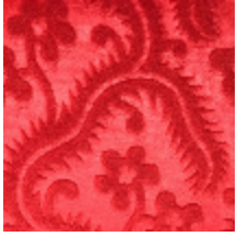
0364-03 AUBUSSON- GROSEILLE