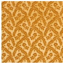
0364-16 AUBUSSON - OR