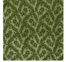
0364-15 AUBUSSON - LAURIER