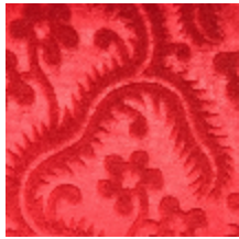
0364-03 AUBUSSON- GROSEILLE