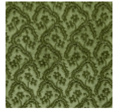
0364-15 AUBUSSON - LAURIER