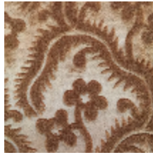
0364-19 AUBUSSON- HAVANE