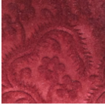
0364-05 AUBUSSON- RUBIS