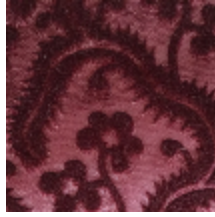
0364-06 AUBUSSON- QUETSCHÉ