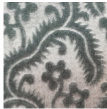
0364-28 AUBUSSON- GLACIER