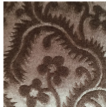
0364-09 AUBUSSON- TAUPE