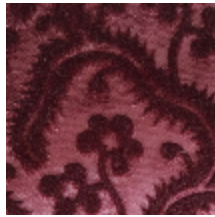
0364-06 AUBUSSON- QUETSCHÉ