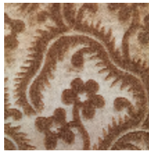
0364-19 AUBUSSON- HAVANE