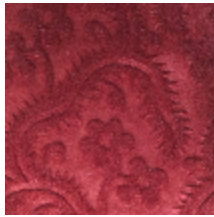
0364-05 AUBUSSON- RUBIS