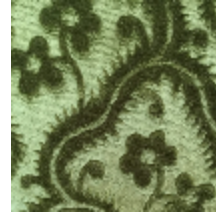
0364-14 AUBUSSON- LENTILLE