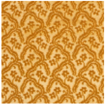
0364-16 AUBUSSON - OR