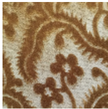
0364-18 AUBUSSON- ECAILLE