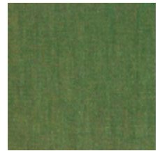
0381-17 MAESTRO- WATTEAU *