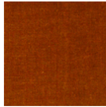
0381-08 MAESTRO- CORNALINE *