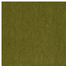
0381-18 MAESTRO- AMANDE *