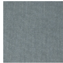
0381-16 MAESTRO-CIEL *