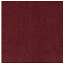
0381-13 MAESTRO- MAUVE *