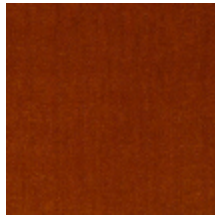
0381-07 MAESTRO- ECUREUIL *