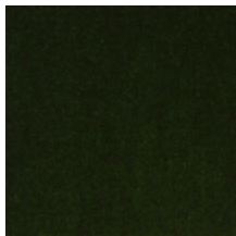
0381-19 MAESTRO-MYRTE *