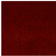
0381-11 MAESTRO- CHAUDRON *