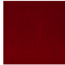
0381-09 MAESTRO- THEATRE *