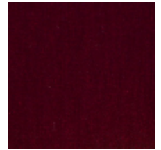
0381-10 MAESTRO- GRENAT *