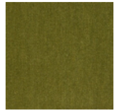
0381-18 MAESTRO- AMANDE *