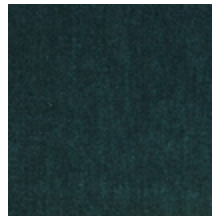
0381-15 MAESTRO- NATTIER *