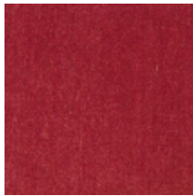
0381-12 MAESTRO-VIEUX ROSE *