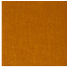
0381-05 MAESTRO- CHAMOIS *