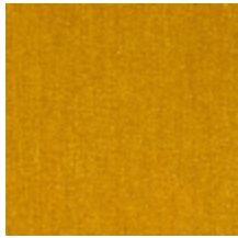
0381-02 MAESTRO-VIEIL OR *