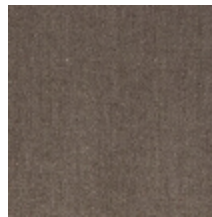
0381-23 MAESTRO- PLATINE *