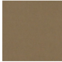
0383-10 COSMOS - CHATAIN