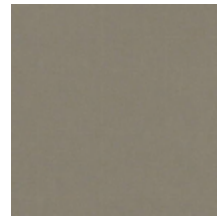
0383-11 COSMOS - TAUPE