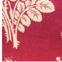
4015-05 ORESTE - CRAMOISI/CREME