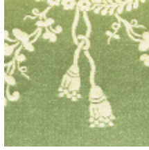
4015-03 ORESTE - VERT/CREME