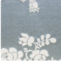
4015-02 ORESTE - BLEU/CREME