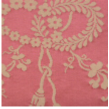
4015-01 ORESTE - ROSE/CREME