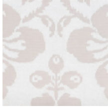
4021-11 DAMAS RECTA - IVOIRE