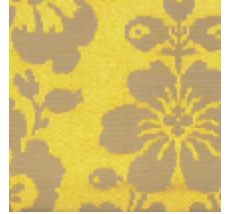
4021-22 DAMAS RECTA - VIEIL OR/BIS