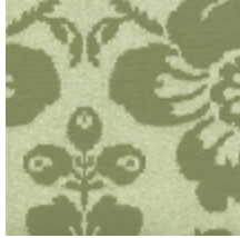
4021-15 DAMAS RECTA - SALADE