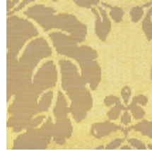
4021-21 DAMAS RECTA - PAILLE