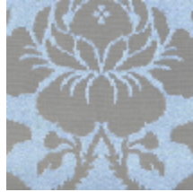
4021-20 DAMAS RECTA - NATTIER/BIS