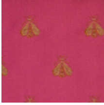
4023-02 LAMPAS ABEILLES - ROUGE