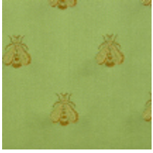
4023-01 LAMPAS ABEILLES - VERT