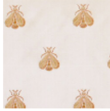
4023-03 LAMPAS ABEILLES - CREME