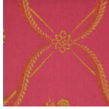
4026-05 LAMPAS SUCHET - CERISE *