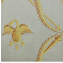
4026-04 LAMPAS SUCHET - NATTIER *