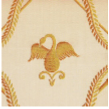
4026-03 LAMPAS SUCHET - CREME