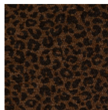
4031-06 FAUVE - CARMEL