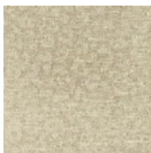
4031-02 FAUVE - ECRU