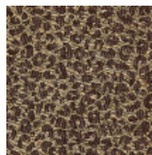
4031-05 FAUVE - BRUN