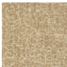
4031-03 FAUVE - BEIGE