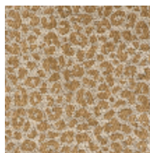
4031-04 FAUVE - OR